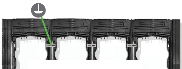
1 EASY GROUNDING je Modul